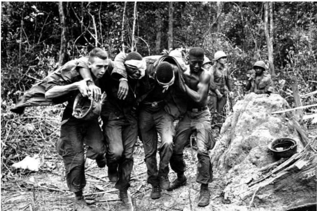
1975 – Падение Сайгона, переход власти к Временному революционному правительству Южного Вьетнама